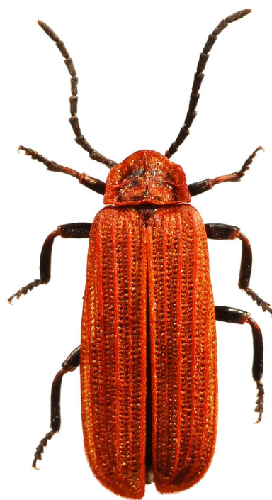
Lopheros rubens Taille : 10 mm

L'espèce est également présente en Allemagne [GEISTHARDT, 1979].